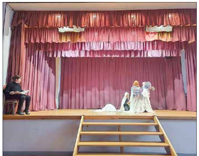
Szene 2 - Ankunft der Feenschwester im Draydenwald und die Begegnung mit der Königin der Vögel