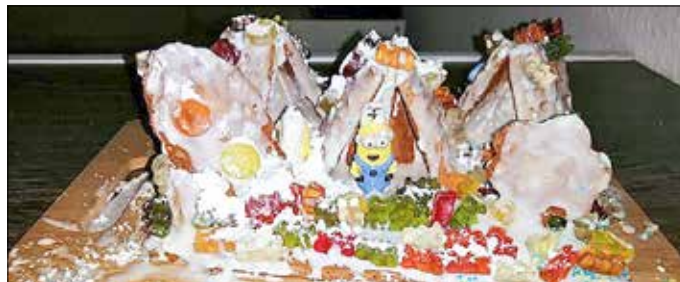
Franziska Albrecht Mobile Jugendarbeit

Kurz vor Weihnachten gestalteten die Kinder und Jugendlichen in Dachrieden ein leckeres Kunstwerk, welches schließlich zur Weihnachtsfeier des Jugendclubs gegessen werden durfte.