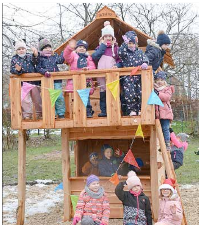
Die Vorschulgruppe der Kita Kleine Strolche durfte als erste das neue Spielhaus ausprobieren.

Tanja Kempfen Förderverein Kleine Strolche