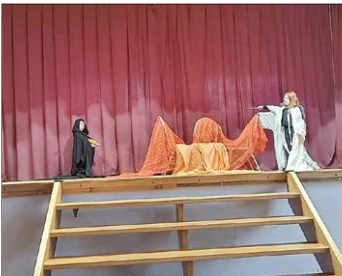
Szene 1 - Die schwarze Gestalt verzaubert das Feenreich in Stein und die Feenschwestern können sich gerade noch retten