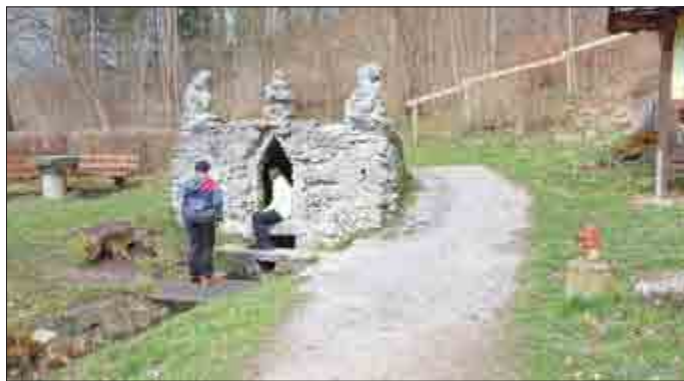
Rosa Weber Mobile Jugendarbeit des Bildungszentrums der KAB gGmbH

In Kleinstbesetzung gestalteten wir unsere Radtour in den Osterferien. Die mobile Jugendarbeit des Bildungszentrums der KAB gGmbH bot diesmal eine Fahrradtour von Dachrieden beginnend nach Kefferhausen zur Unstruttquelle für die Teilnehmer des Jugendtreffs an. Dazu nutzen wir den beliebten Unstrut Radweg, der uns jedoch auch auf öffentliche Straßen entlangführte. Dies war eine gute Gelegenheit, das Verhalten im Straßenverkehr und dessen Regeln aufzufrischen. Ein kleines Picknick sowie ein Eis bildeten den Abschluss dieser Radtour.