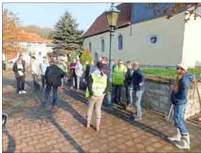
Besprechung vor dem Start

Wir freuen uns, dass unsere Jugend so zahlreich unter den Helfern vertreten war.